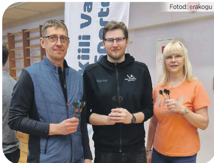
▲ Darts, Kangru võistkond.