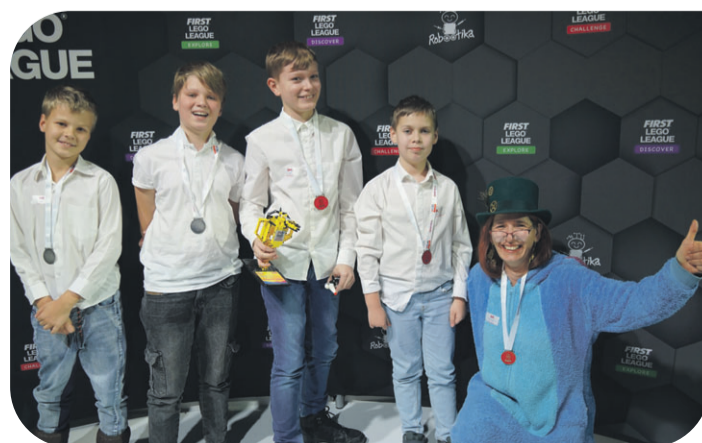
▲ Robotikud meeskonnast „Chill“.