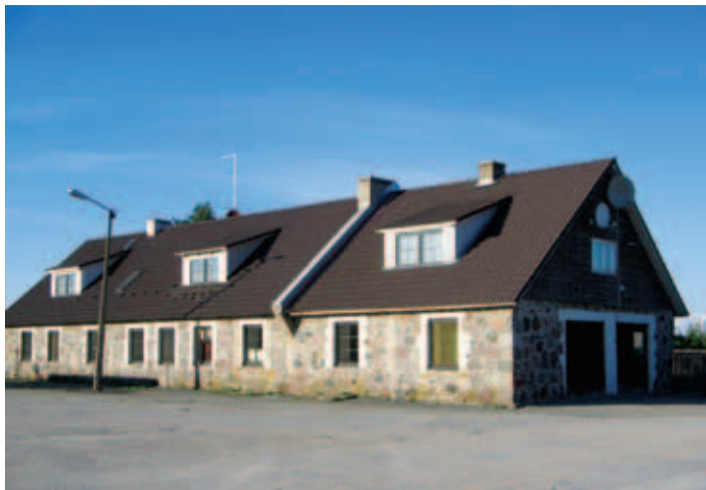
Endine Kiili kõrtsihoone, hiljem Sondla kauplus ja siis kolhoosi töökoda ja garaazh. Pildistatud aastal 2008.