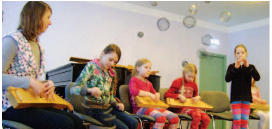
Kuus kandlepäev Kehtna Kunstide Koolis. KKK

Kiili kunstide kooli seinte vahel oli kannel enne pärimusmuusikute tegevuse algust vii-