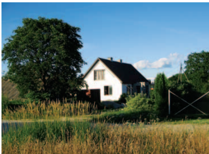
Endine Rahva Võidu kontori hoone. Pildistatud aastal 2008.

Vana Baskini teater: Alan Ayckbourni'i "Jäägu meie vahele"