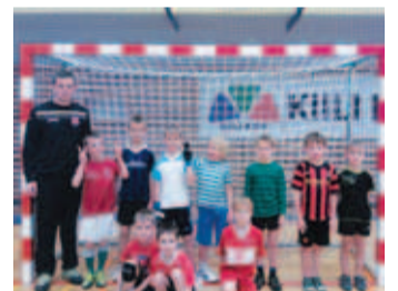
Kiili jalkapoisid. Harju JK